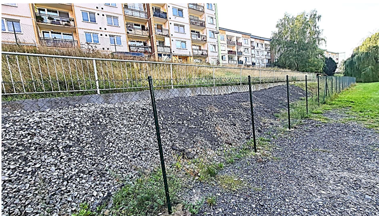
Obrázek 4 – Pohled od severozápadu na opěrnou zeď při východní straně