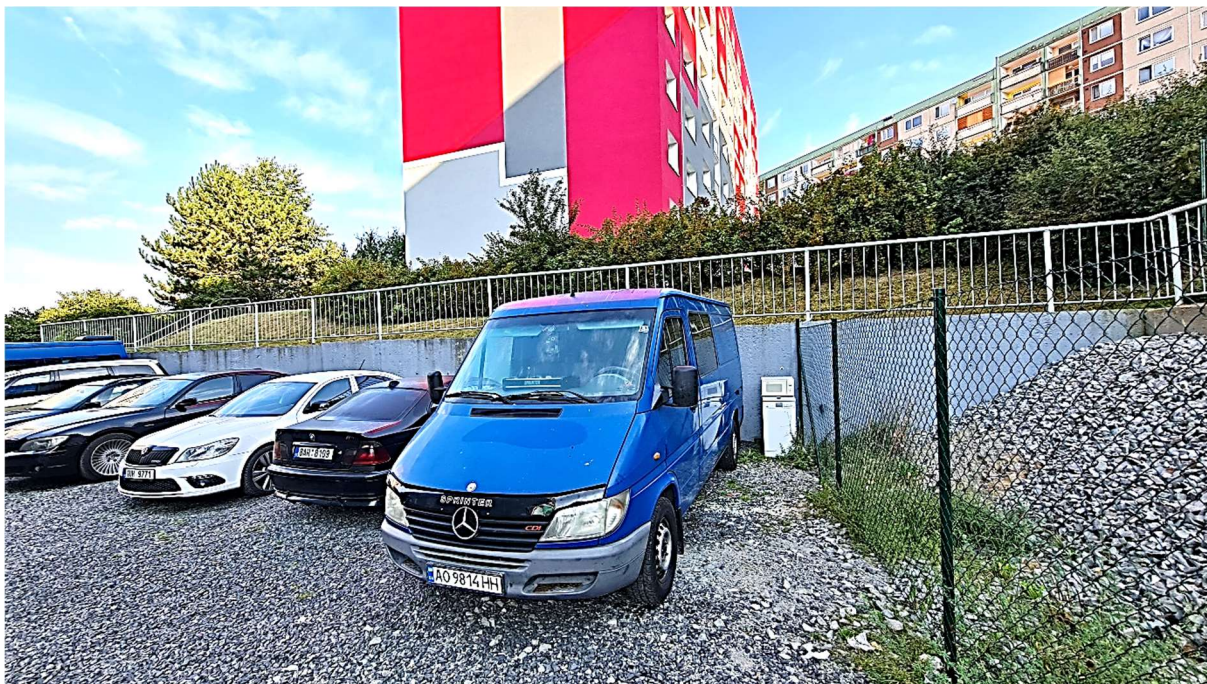
Obrázek 3 – Pohled od jihovýchodu na opěrnou zeď při severní straně

DOKUMENTACE PRO VYDÁNÍ SPOLEČNÉHO POVOLENÍ A PRO PROVÁDĚNÍ STAVBY