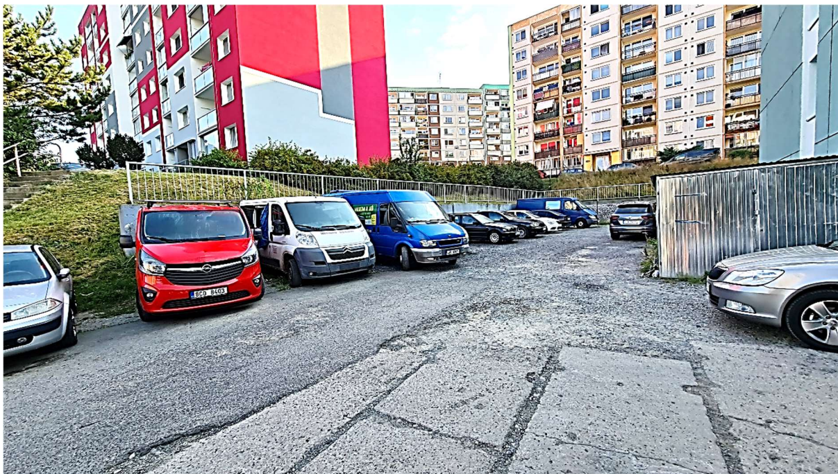
Obrázek 1 – Pohled od jihozápadu na opěrnou zeď při severní straně

DOKUMENTACE PRO VYDÁNÍ SPOLEČNÉHO POVOLENÍ A PRO PROVÁDĚNÍ STAVBY