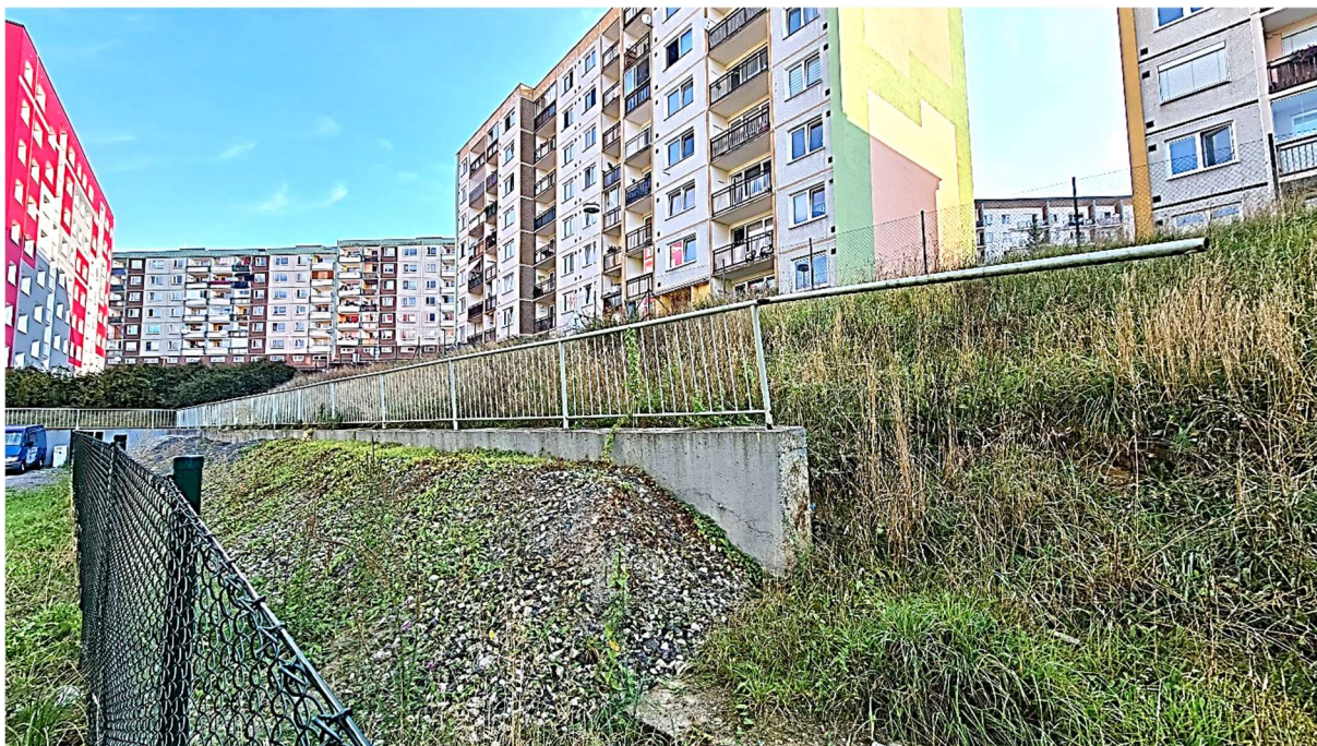
Obrázek 5 – Pohled od jihozápadu na opěrnou zeď při východní straně

DOKUMENTACE PRO VYDÁNÍ SPOLEČNÉHO POVOLENÍ A PRO PROVÁDĚNÍ STAVBY