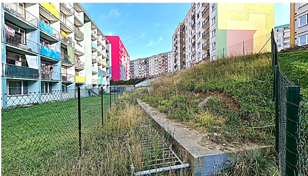
Obrázek 6 – Pohled od jihozápadu na opěrnou zeď při východní straně