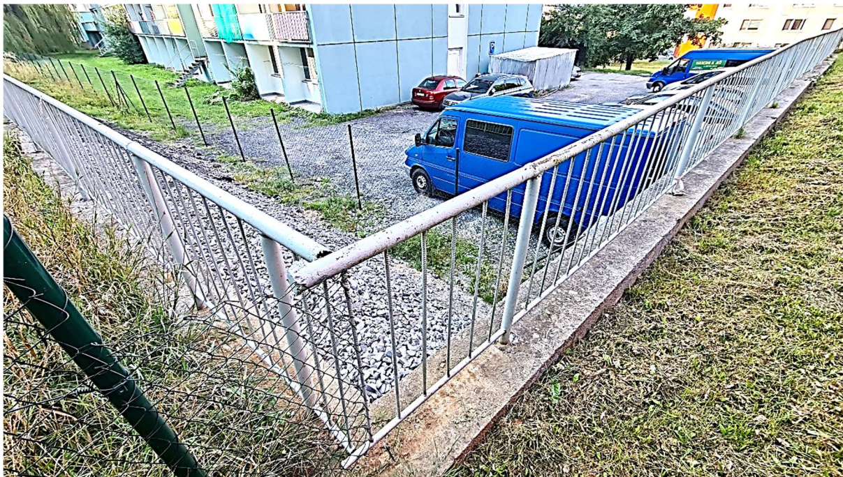
Obrázek 7 – Pohled od severovýchodu na opěrnou zeď při severní a východní straně

DOKUMENTACE PRO VYDÁNÍ SPOLEČNÉHO POVOLENÍ A PRO PROVÁDĚNÍ STAVBY