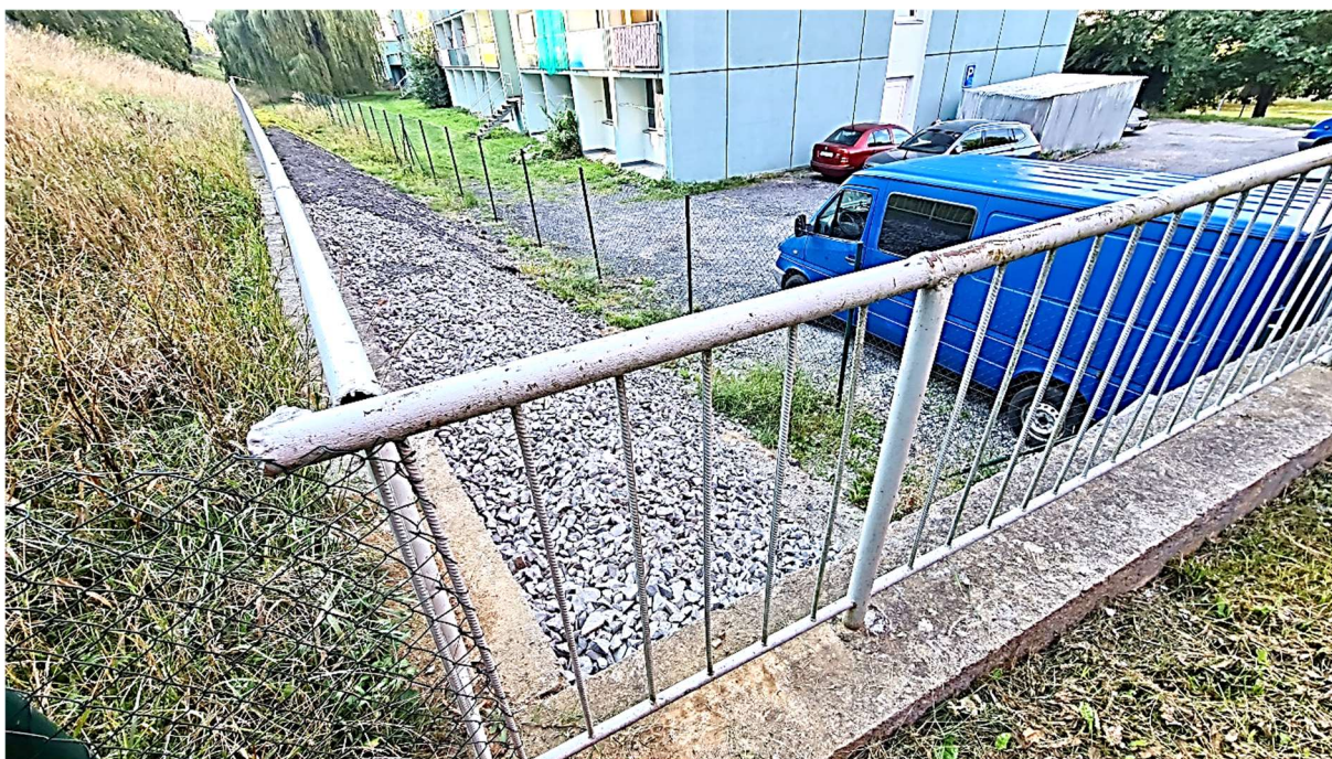
Obrázek 8 – Pohled od severovýchodu na opěrnou zeď při severní a východní straně